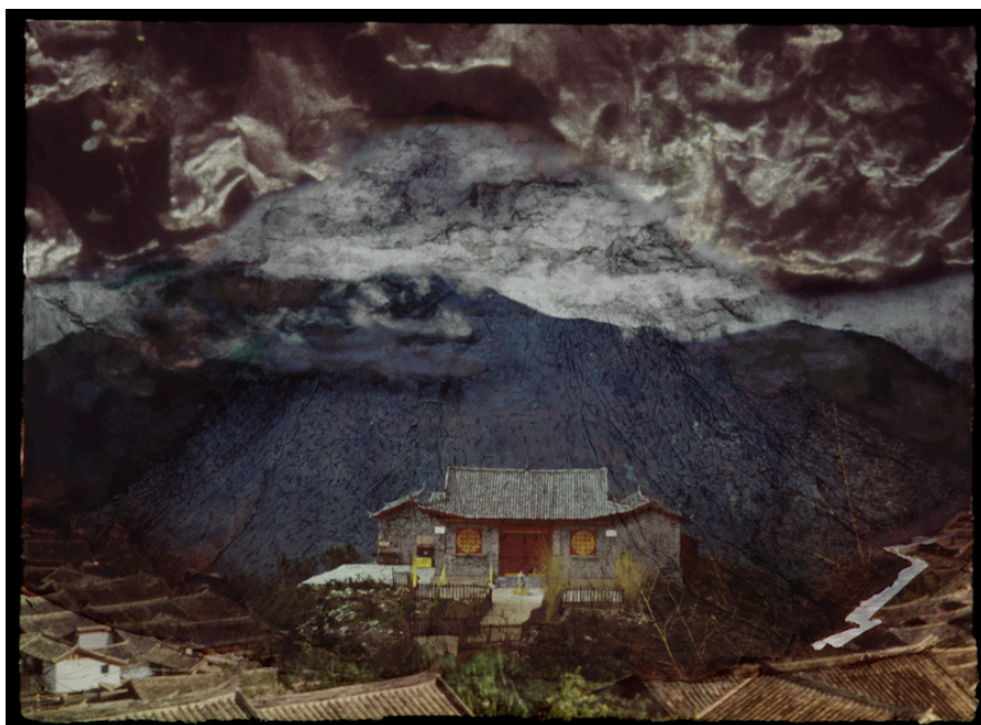
Place Without Description - Housescape Stonestorm 2007-2008

Martedì 9 ottobre alle ore 10.30 incontro con l'artista nell'Aula Edoardo Benvenuto dell'Università di Genova, Scuola Politecnica / Dipartimento di Scienze per l'Architettura.