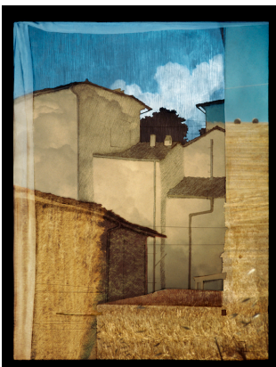
Via Dei Solitari - hayballs-cloud 2011

Nell'intervista rilasciata a Daniele Balicco e Massimiliano Tomba, l'artista motiva così il suo processo creativo: Nel mio studio cerco di individuare la veduta “ideale”, una sorta di “matrice” per l'architettura del progetto. Utilizzando i disegni precedentemente fatti creo un collage in basso rilievo su quale proietto poi, con quattro o cinque vecchi proiettori non digitali, pezzi delle diapositive. Non uso mai diapositive scattate in altri posti, perché il mio scopo non è creare un processo interpretativo romantico o espressionista, piuttosto cerco di raggiungere una descrizione del posto su tanti livelli allo stesso tempo, anche abbandonando le regole della prospettiva. Infine saranno le fotografie delle diapositive proiettate sul collage a costituire l'opera finale, suggerendo nuove possibilità di vedere.