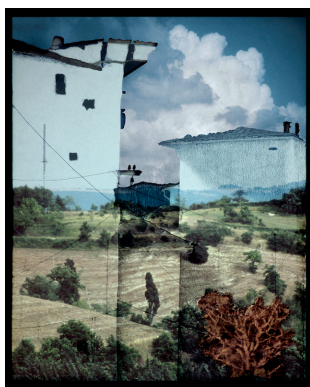
Via Dei Solitari - Haytree 2011